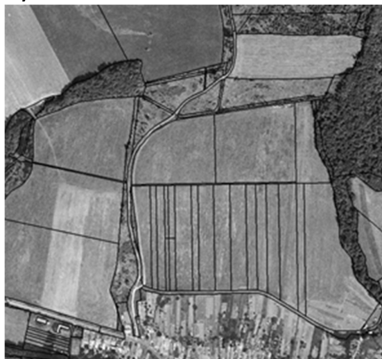
stav po pozemkových úpravách